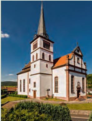
Kath. Kirche St. Michael