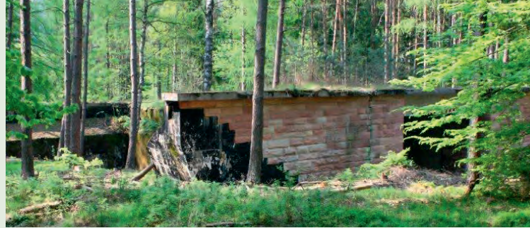
Strecke 46 – Reste des historischen Vorläufers der heutigen Autobahn A7

Durch die Ausdehnung des bereits bestehenden „Bikewald Spessart“ auch auf den Sinngrund besteht eines der größten zusammenhängenden Bikesportgebiete Deutschlands ( www.bikewald-spessart.de ).