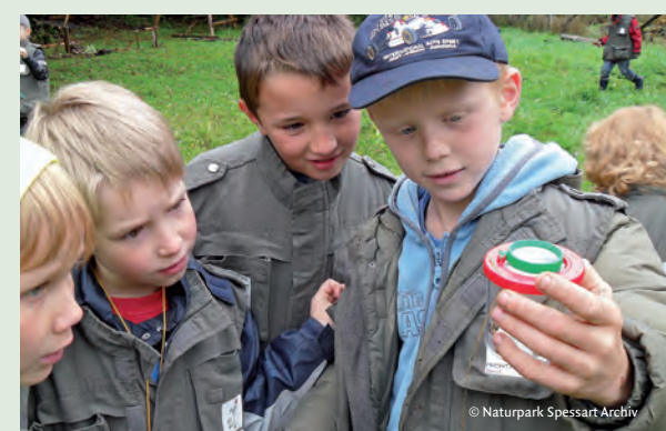
Eines der aktuellsten Projekte des Naturparks ist der Feuchtwiesenerlebnispfad in Frammersbach. Auch hier wird spielerisch Wissen vermittelt und Begeisterung für die Natur geweckt.