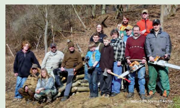
Im Rahmen des Grünlandprojekts werden regelmäßig Pflegemaßnahmen durchgeführt, z.B. im Dammbachtal, wo verbuschte Wiesen wieder hergerichtet werden.