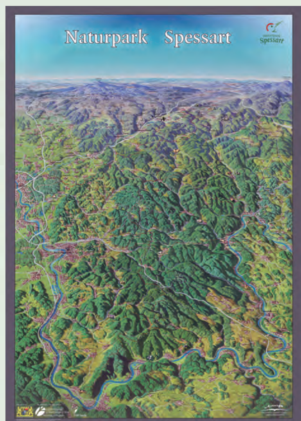
Die alte Panoramakarte aus den 1960ern bekommt 2012 einen Nachfolger.