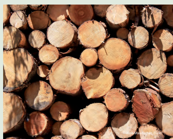
Holz - das Gold des Spessarts. Wie werden wir es zukünftig nutzen?