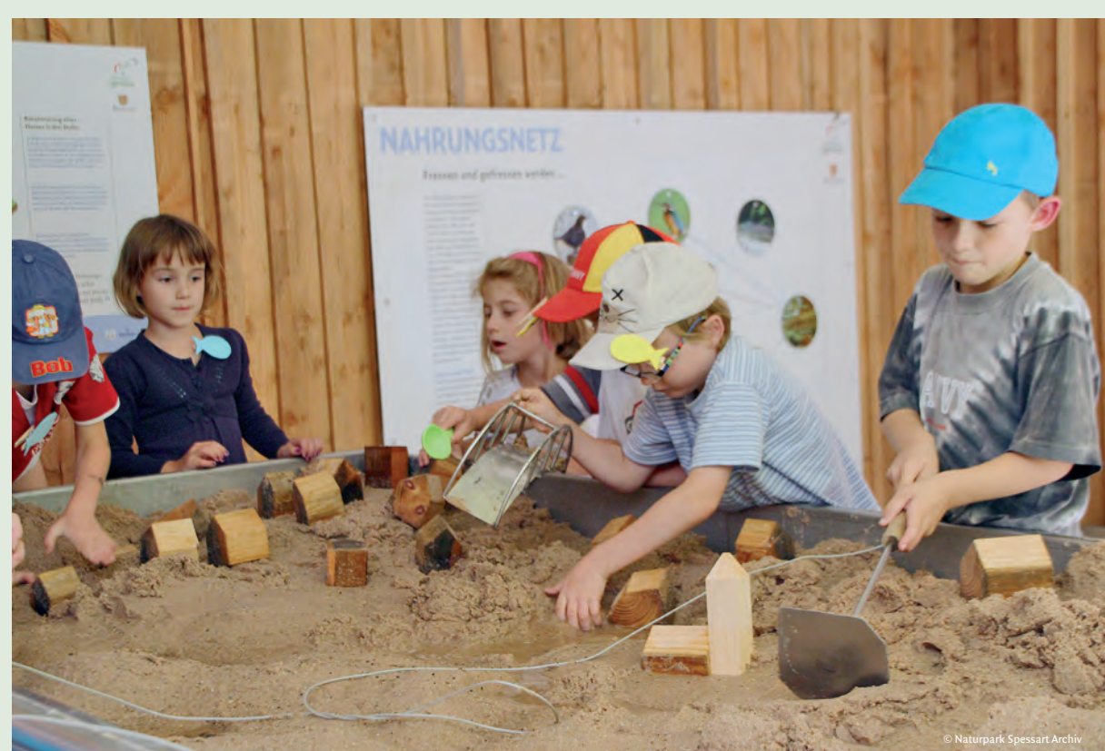
Lernen mit allen Sinnen: Im Wassererlebnishaus stehen Experimentieren und Spielen an erster Stelle, z.B. beim Hochwassermodell.