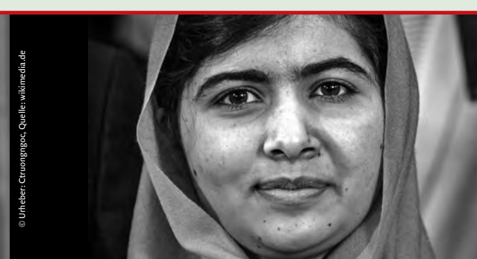
Attentat auf Malala Yousafzai