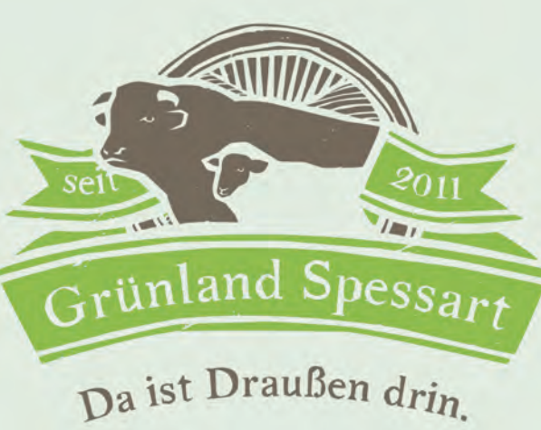
Über die vom Naturpark mitgegründete Initiative Grünland Spessart wird seit 2011 Fleisch von den Weiden der Region vermarktet.

Das 2007 begonnene Grünlandprojekt des Naturparks bekommt ab 2010 personelle Unterstützung - zunächst von zwei „Grünlandmanagern“, ab 2011 durch einen sogenannten „Gebietsbetreuer“. Sie beraten Landnutzer und Kommunen, entwickeln Nutzungskonzepte für Grünlandbiotope, betreuen Weidevorhaben, organisieren Pflegemaßnahmen und vermitteln in Konfliktfällen.