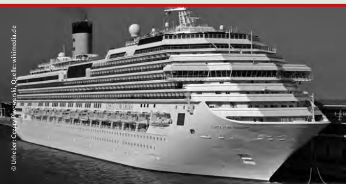
Die "Costa Concordia" sinkt vor Giglio