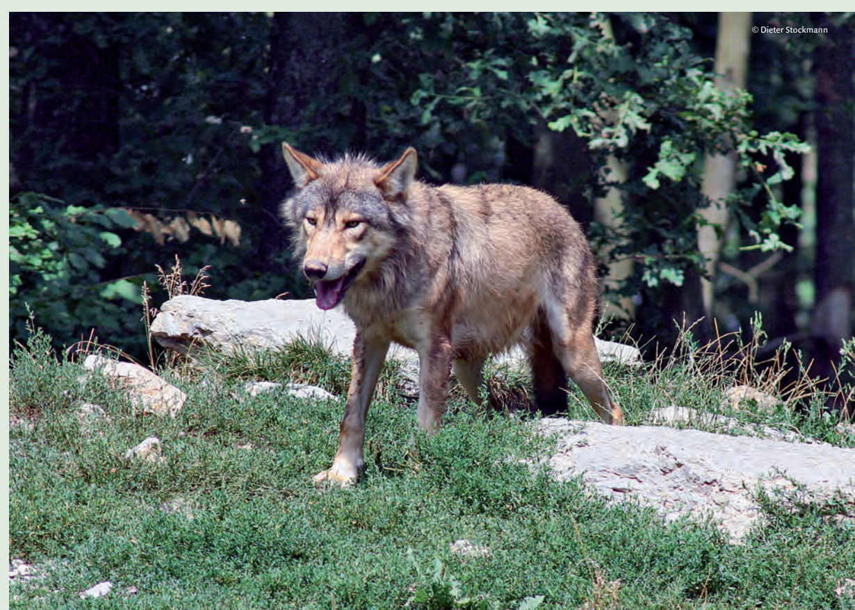
Wann kehrt der Wolf zurück? Experten schätzen, dass in einigen Jahren der Wolf von Südbayern oder der Lausitz aus auch wieder den Spessart besiedeln könnte.