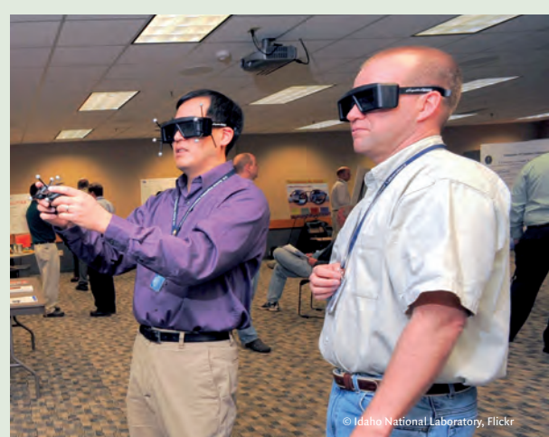
Wandern wir zukünftig mit der Datenbrille durch einen virtuellen Spessartwald?