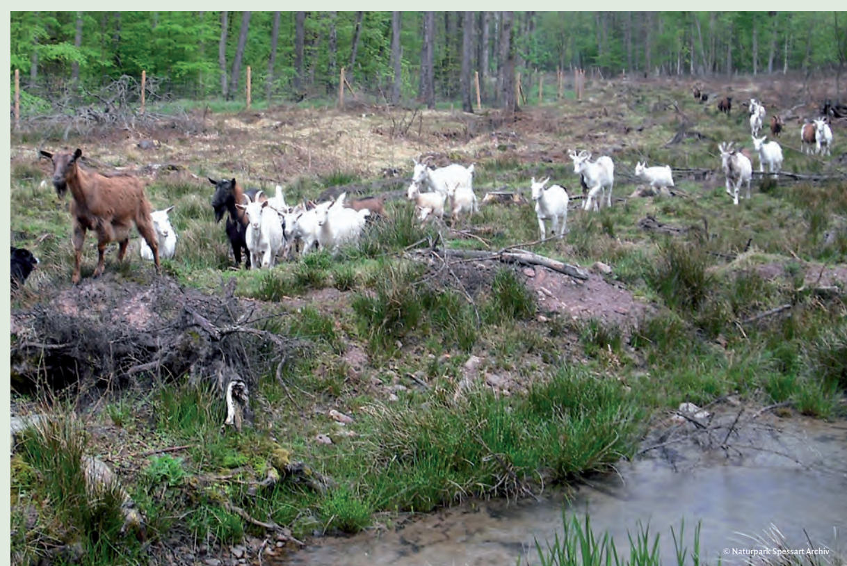
Schafe, Rinder und Ziegen sollen die Spessarttäler langfristig offen halten. Im Hafenohtal kommen seit 2009 auch Wasserbüffel zum Einsatz.