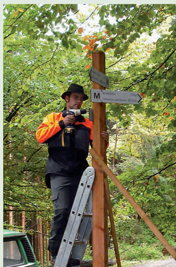
850 Wegweiser und Tausende von Markierungszeichen weisen seit 2011 den richtigen Weg.

Mit dem Tourismus im Spessart geht es bergauf – die Übernachtungszahlen steigen wieder. Besonders der Radtourismus ist beliebt. Vor allem der Mainradweg bringt viele Gäste in die Region. Anteil an dieser Entwicklung haben die E-bikes, die auch weniger Sportliche aufs Fahrrad bringen.