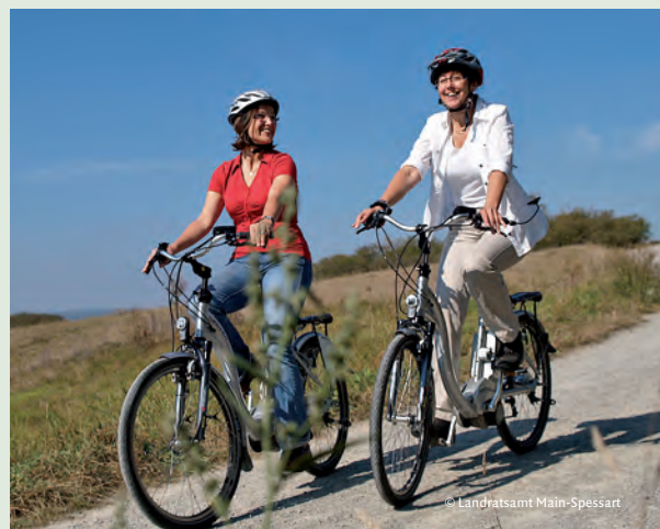
E-bikes liegen derzeit voll im Trend.

Doch auch Wandern bleibt ein Freizeittrend. Zertifizierte Fernwanderwege wie der Spessartweg 1&2 locken in den Spessart. Und nach Abschluss der 2006 begonnenen Wanderwegeüberarbeitung stehen 2011 über 4.500 km markierter Wanderwege zur Verfügung. Neue Wanderkarten, ein Tourenportal im Internet sowie über 100 Informationstafeln und 850 Wegweiser im Gelände sorgen dafür, dass Spaziergänger und Wanderer ihren Weg finden.