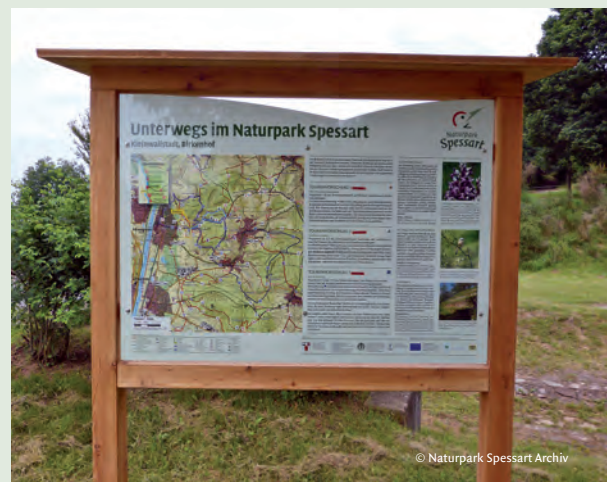
Zwischen 2011 und 2013 wurden 117 Informationstafeln zur Besucherlenkung im Naturpark aufgestellt.