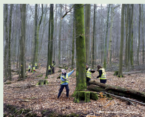
Greenpeace löste 2012 mit Protest-Aktionen im Spessart kontroverse Diskussionen über die Nutzung der Wälder aus, die uns sicher noch eine Weile begleiten werden.