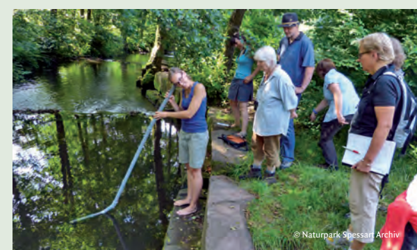
2012 wurden 20 neue Natur- und Landschaftsführer ausgebildet.