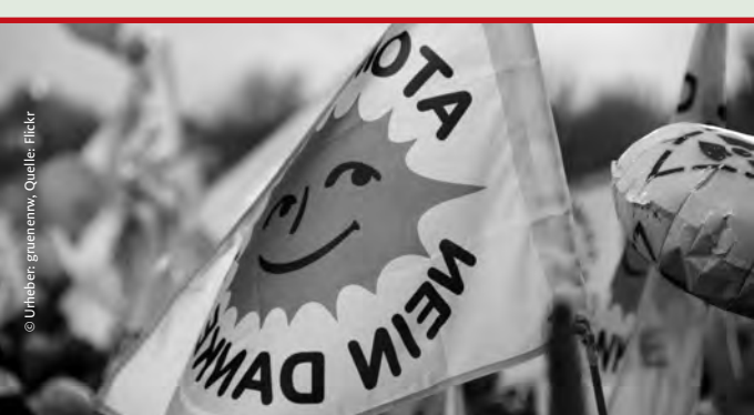
Atomausstieg nach Fukushima