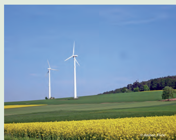
Großwindkraftanlagen – bald auch im Spessart?