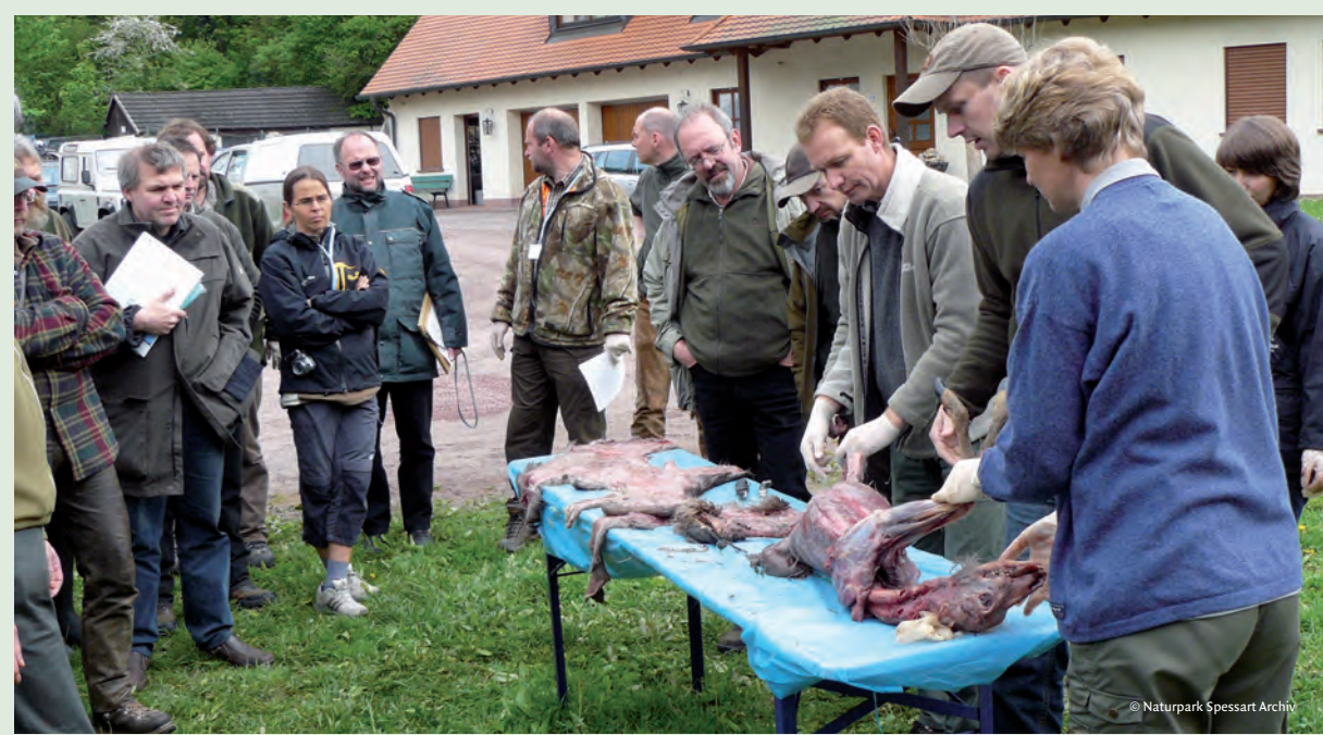
2010 werden gemeinsam mit der Landesanstalt für Umwelt „Luchsbeauftragte“ im Naturpark ausgebildet. Sie sollen Aufklärungsarbeit leisten und etwaigen Spuren der scheuen Großkatze nachgehen.