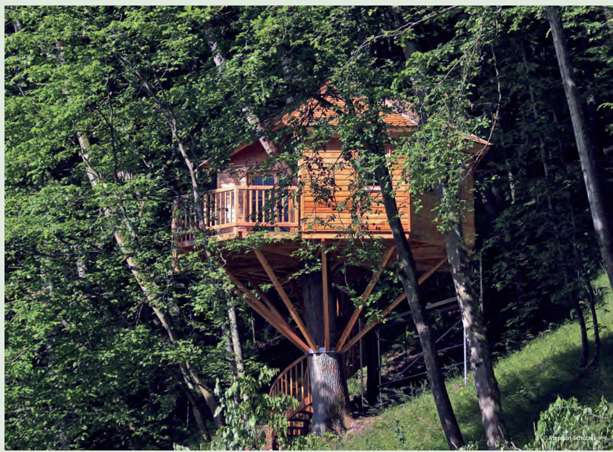
Schlafen im Baumhaus – auch im Spessart inzwischen möglich – seit 2011 im Baumhaushotel in Mönchberg und ab Ende 2014 auch in Gräfendorf.