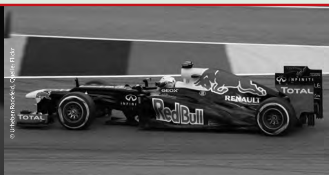
Vettel jüngster Formel 1-Gewinner