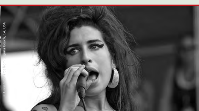
Soulsängerin Amy Winehouse stirbt