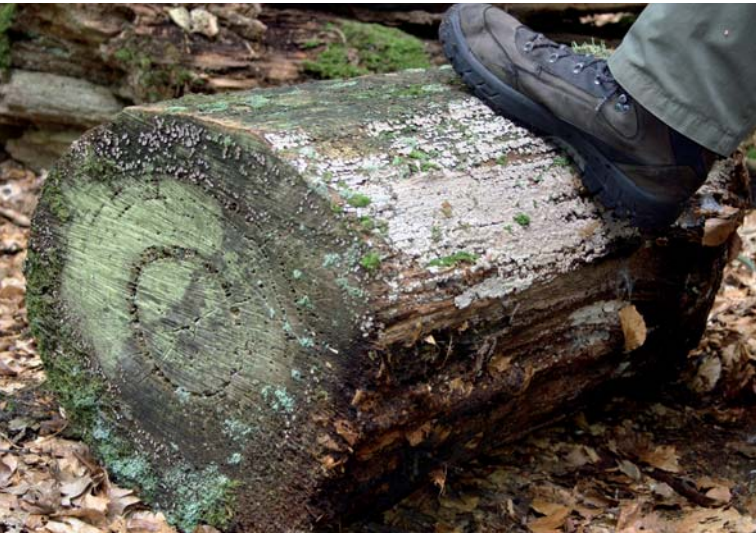
An toten Eichenstücken zu finden: der Eichenmosaikschichtpilz

Der Mosaikschichtpilz ist auf die Zersetzung von starkem, verkerntem Eichenholz spezialisiert. Nur in Beständen mit einem hohen und starken Totholzvorkommen konnte er überleben. Er gehört zu den eher unscheinbaren Vertretern der Rindenpilze, ist aber an seinem pflastersteinartigen Fruchtkörper gut zu erkennen. In Trockenphasen spaltet sich sein Fruchtkörper mosaikartig auf, was ihm seinen Namen gab.