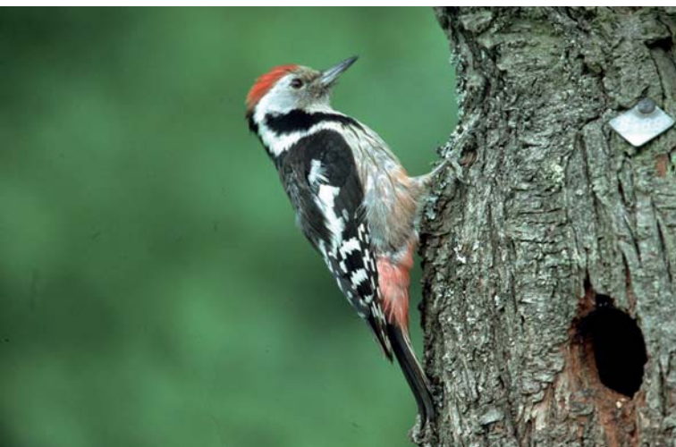
Ein typischer Eichenwaldbewohner: der Mittelspecht

Die Familie der Spechte ist im „Spechtshaard“, dem Spessartwald, zahlreich vertreten. Bunt-, Schwarz-, Grau-, Klein- und Mittelspecht finden hier als so genannte „Zimmerleute des Waldes“ vielfältigen Lebensraum. Der Mittelspecht und der Grauspecht gelten als „Urwaldspechte“ schlechthin. Als Bewohner von Laubwaldregionen finden sie in der Kombination aus gewaltigen Alteichen und Totholz ideale Bedingungen. Der Mittelspecht ist in seinem Aussehen dem wesentlich häufiger vorkommenden Buntspecht sehr ähnlich. Das erwachsene Männchen kann jedoch deutlich an seiner roten Haube erkannt werden. Der Mittelspecht ernährt sich überwiegend von Insekten und ist zusätzlich noch auf Rindenbewohner sowie auf deren Larven und Puppen spezialisiert, die er mit seinem biegsamen Schnabel in den Ritzen der Borke findet. Er wird deswegen als „Stocherspecht“ bezeichnet und ist eher ein heimlicher Vertreter der Spechtfamilie. Man hört ihn wesentlich seltener klopfen als zum Beispiel den Buntspecht.