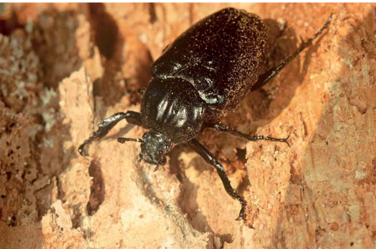
Typischer, aber äußerst seltener Vertreter in alten Laubbäumen: der Eremit

Ein besonderer Vertreter, der etwa drei Zentimeter große Eremit war schon immer aus dem Hochspessart bekannt. Dieser bronze-braunfarbene Käfer, der wie der Maikäfer zur Familie der Blatthornkäfer gehört, ist auf Mulmhöhlen in alten Laubbäumen angewiesen. Hier entwickeln sich die Larven in drei bis vier Jahren zu fertigen Käfern. Sie ernähren sich von Holz, das zuvor von Pilzen zersetzt wurde. Ein besiedelter Baum wird manchmal über Jahrhunderte von einer Käferpopulation genutzt.